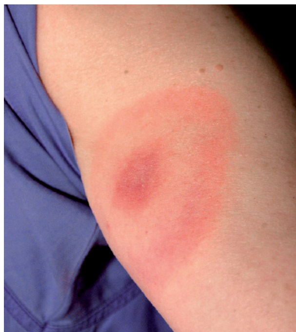
Figura 1. Eritema migrante tipico della malattia di Lyme

• Utilizzare i dati clinici insieme ai test di laboratorio per guidare diagnosi e terapia delle persone senza eritema migrante. Non escludere la diagnosi se i test sono negativi ma esiste un sospetto clinico elevato di malattia di Lyme. [Raccomandazione basata su evidenze di qualità molto bassa da